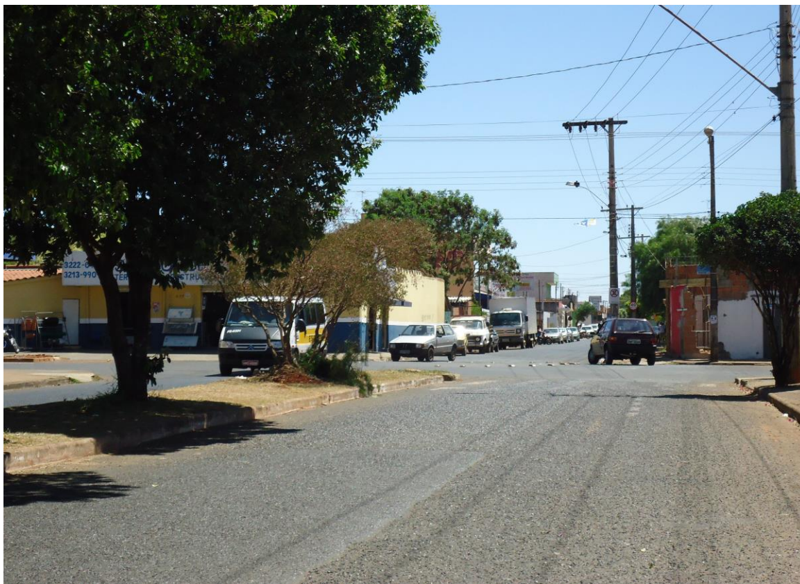
Figura 4: Rua Taxisista Fábio Cardoso que dá continuidade à avenida Serra da Mantiqueira

Em relação aos tipos de modais de transporte observa-se que as pessoas se deslocam através de bicicletas, carros, motos além do transporte público, mas dentre esses modais o que predomina na periferia do bairro é a utilização de bicicletas, enquanto na região central o uso de veículos automotivos na maioria das vezes com mais de dez anos de uso que circulam em ruas estreitas e tortuosas sendo a maioria de vias duplas. A figura 4 retrata o modelo de uma rua bem característica do bairro a qual inicia-se com uma rua comercial denominada Taxista Fabio Cardoso caracterizada por ser estreita de mão dupla que permite estacionamento, ao meio se transforma em uma larga avenida denominada Serra da Mantiqueira.