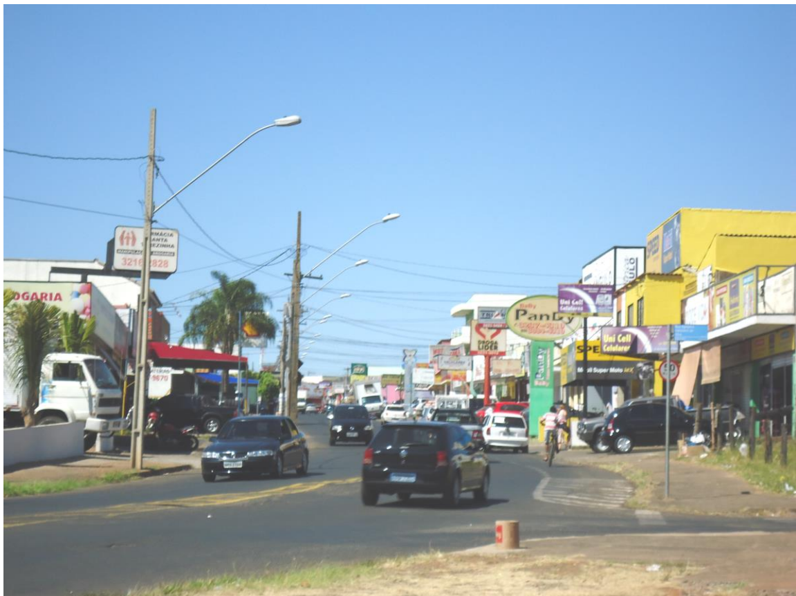
Figura 3: Rua do centro comercial do bairro São Jorge

Esse bairro é, atualmente, considerado o segundo maior da cidade de Uberlândia (MG) devido a sua integração aos bairros São Jorge I, II, III, IV e V, Quinhão, Jardim das Hortências, Parque Primavera, Campo Alegre, São Gabriel, Viviane e Seringueiras. Conta com um centro comercial com vários tipos de comércio, casas lotéricas, três agências bancárias, postos de gasolina, prestadores de serviços em vários ramos como consertos de aparelhos celulares, computadores, dentre outros, bares, padarias, possui um grande hipermercado pertencente a uma rede, serviços públicos de saúde, igrejas evangélicas e católicas, praças publicas. No que tange a educação possui várias escolas particulares de ensino infantil, EMEI (escola municipal educação infantil), escola estadual de educação básica (ensinos fundamental e médio). A figura 3 retrata uma das ruas do centro comercial do bairro.