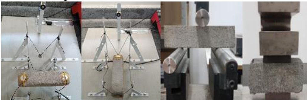
Figura 1: Amostras submetidas aos ensaios acústicos e mecânicos

A Figura 1 apresenta a execução dos ensaios acústicos e mecânicos realizados na pesquisa, evidenciando as amostras sendo submetidas aos equipamentos adequados para a condução dos testes.