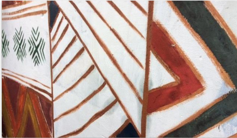
Figura 8: Gráficos Indígenas/Boteco de Wilma, 2017