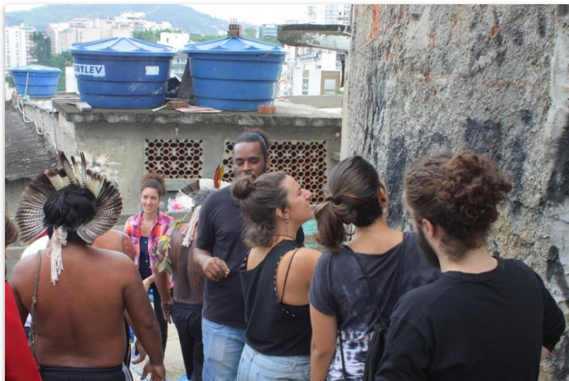
Figura 2: Txhyfeldja Fulni-ô/Jefferson, 2017