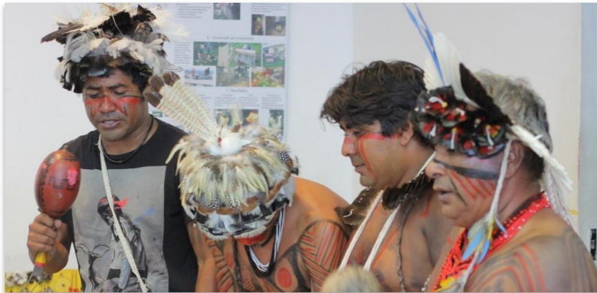
Figura 1: Indios Fulni-ô /MACquinho

Esta manifestación de violencia urbana generó tensiones que aparentemente ya se habían resuelto en la relación entre los vecinos y los cuarteles de los jóvenes narcotraficantes que ocupan la comunidad. Este proyecto contó con música, danza y artesanías de los indígenas Fulni-ô, con el objetivo de asegurar que los residentes de esa comunidad y los estudiantes universitarios pudieran adquirir los conocimientos y habilidades necesarias para promover un estilo de vida sustentable, con énfasis en las actividades y presentaciones de artistas indígenas.