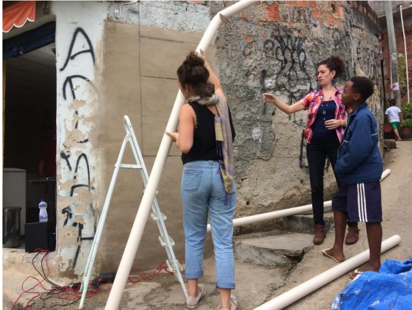
Figura 10: Estructura del Muro Verde / Tuberías de agua, 2017