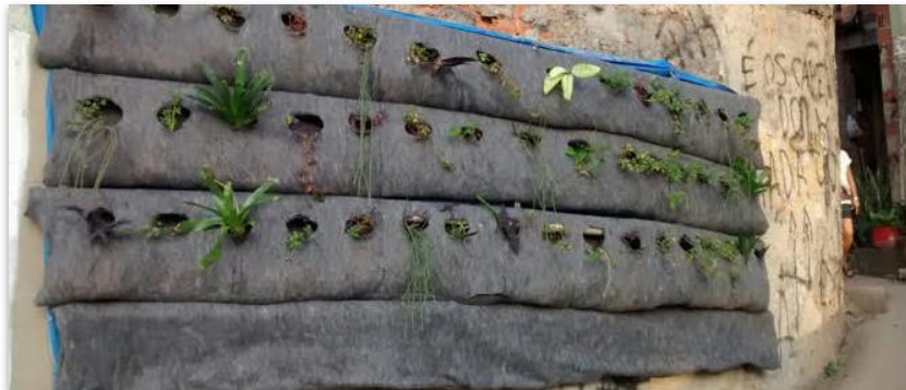
Figura 6: Prototipo /Huerto Urbano, 2017

El objetivo del proyecto es abrir debates con los habitantes de la favela sobre la vigencia del proyecto y la construcción de prototipos de Muros Verdes y Gráficos Indígenas en MACquinho por parte de profesores de la Universidade Federal Fluminense, con la participación de más de 400 constructores de Morro. de Palacio.