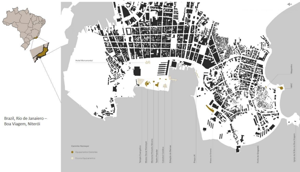
Figure 4: Ubicación del “Palco-Oca”