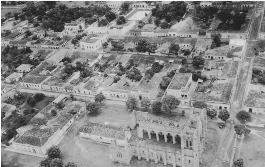
Foto 3 - Área central de Cáceres-MT con lotes y Catedral de San Luiz.

Fuente: Acervo IBGE. Autor: Faissol, Speridião, 1923-; Faludi, Susan. Fecha: 1953.