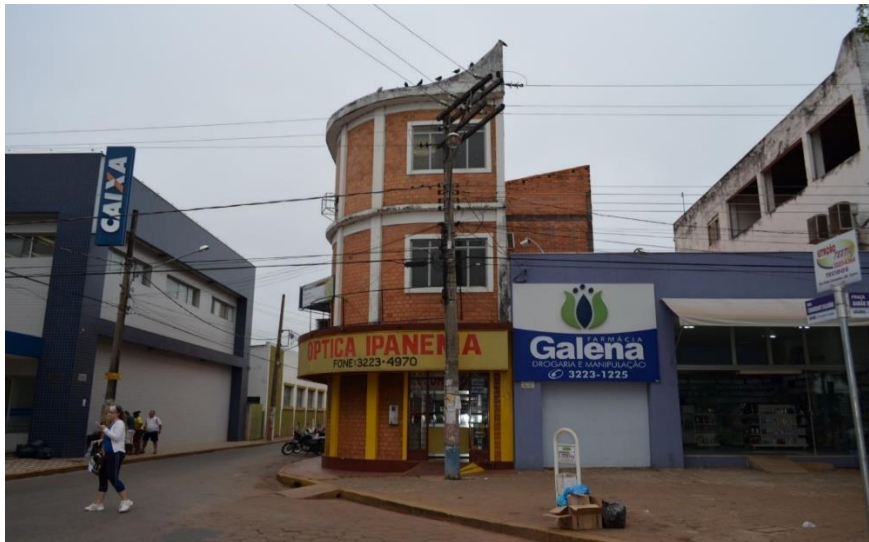
Foto 2 - Edificaciones con más de 1 piso al entorno de la Catedral de San Luiz, plaza Barón del Rio Branco, Cáceres-MT.