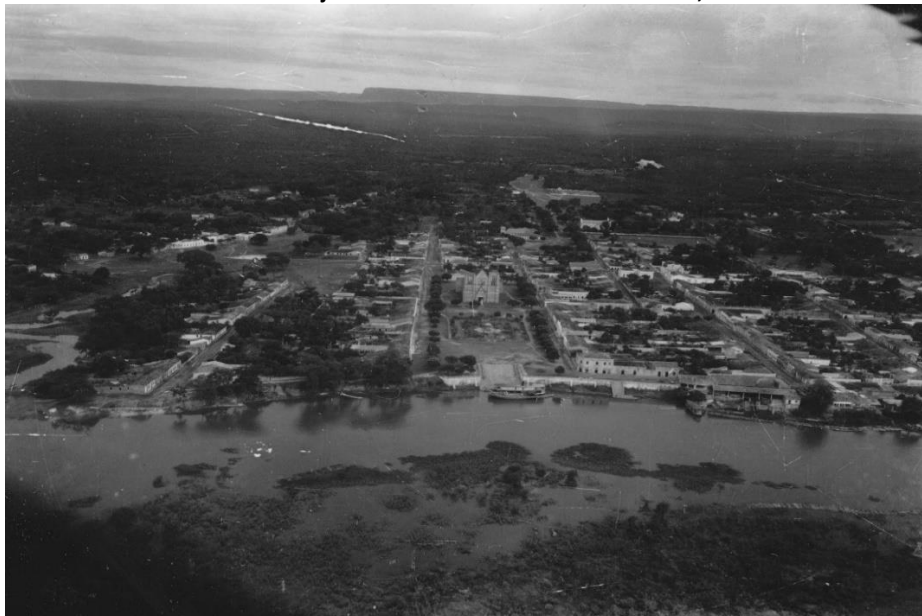
Foto 1 - Paisaje con Catedral de San Luiz de Cáceres, MT.