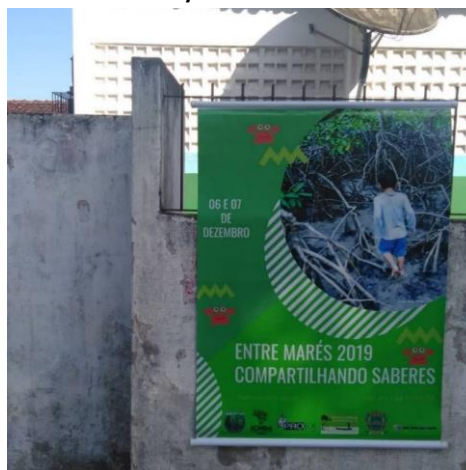
Figura 1: Cartel del Proyecto de Extensión "Entre Marés".