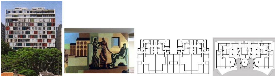
Figura 11: Edifício Lausanne

Foto de Leonardo Finotti - https://www.wikiart.org/pt/almeida-junior/cena-de-familia-de-adolfo-Augusto-pinto-1891 - acceso el 11 de noviembre de 2021. Foto del y dibujo del autor