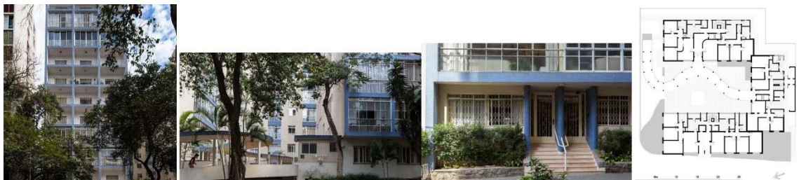
Figura 8 Edifício Itamarati

Fotos: Leonardo Finotti: http://www.leonardofinotti.com/projects/itamarati-building - acceso el 11 noviembre 2021. Planta: dibujo del autor