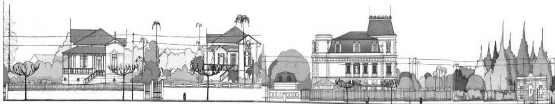
Figura 1: Paisaje típico de la Avenida Higienópolis