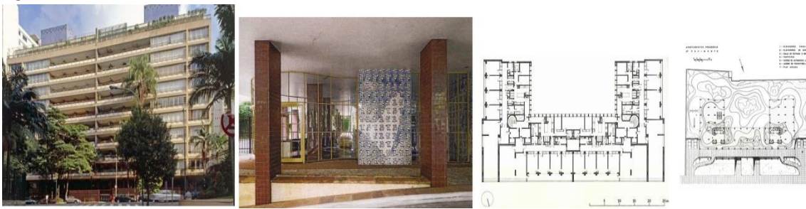
Figura 6: Edifício Prudência

Plano: dibujo del autor. Planta do térreo: ACRÓPOLE 154 (1951)