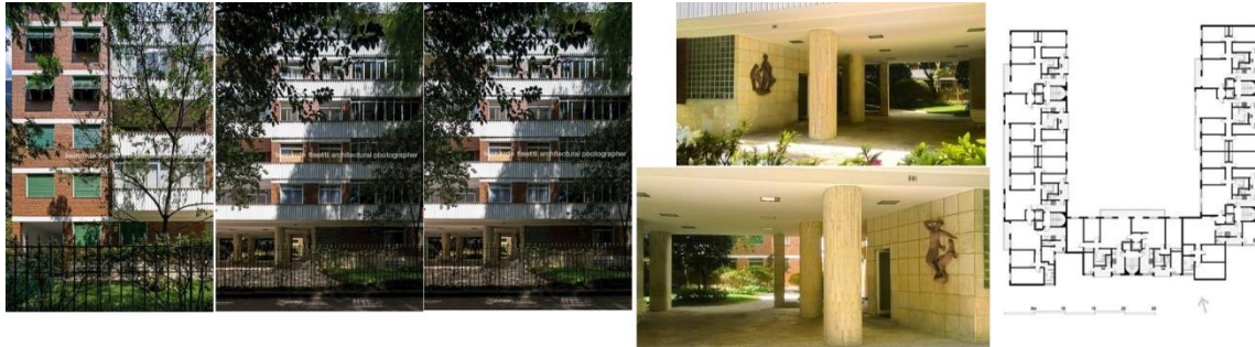
Figura 7: Edifício São Vicente de Paula

Fotos: Leonardo Finotti: http://www.leonardofinotti.com - acceso el 10 de noviembre de 2021. Fotos y dibujo del autor