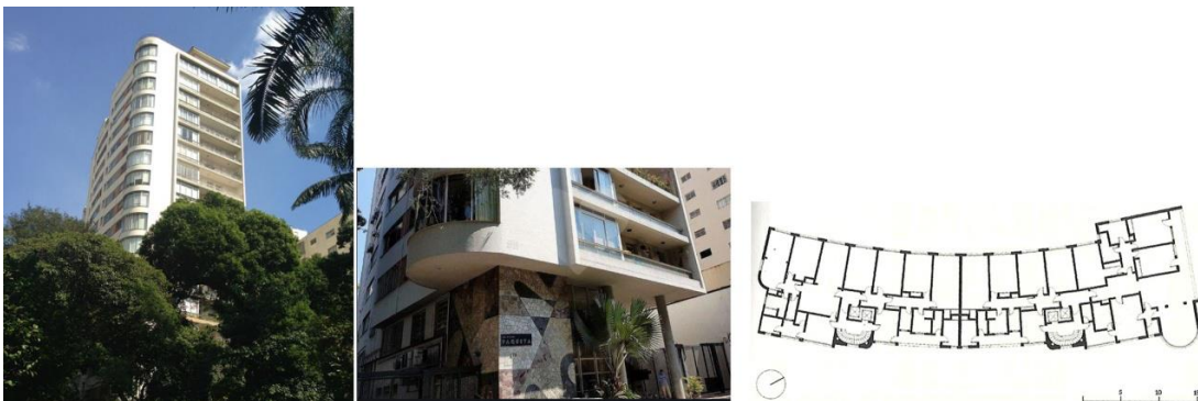
Figura 10: Edificio Paquita

Foto y dibujo del autor. Tipo de letra de la foto intermedia: