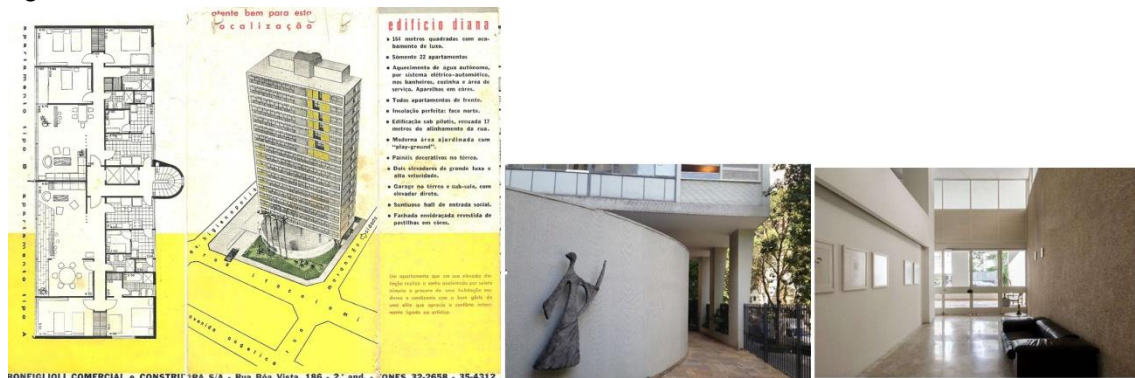
Figura 12: Edifício Diana

Folheto promocional de venda.