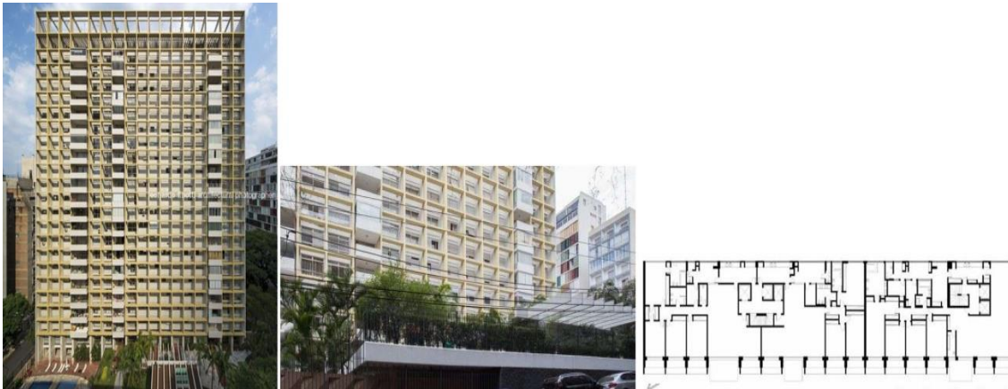
Figura 9: Edificio Parque Higienópolis

Planta: dibujo del autor