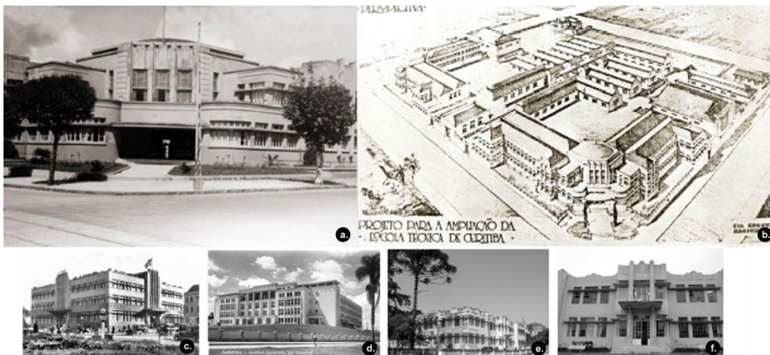
Figura 7: Los ejemplares monumentales protegidos del art déco de Curitiba a - b) Escuela de Aprendices Artífices (1934); c) Colegio Estadual de Paraná (1943); d) Correos y Telégrafos (1934); e) Instituto de Ciencias Agrarias f) Fachada edificio Agrarias (1935).