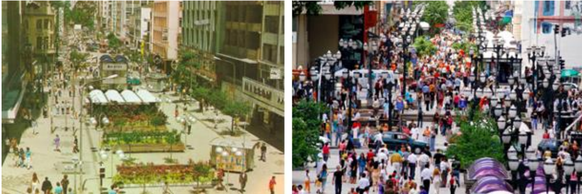
Figura 2: Intervención en la Calle XV de Noviembre (1977) y perspectiva actual con alteración de mobiliario.