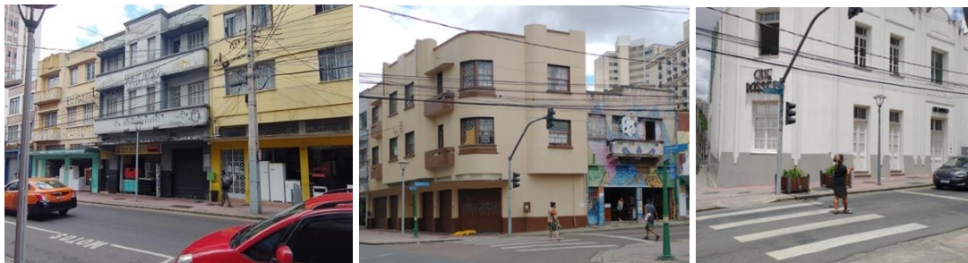
Figura 06: Estado de conservación, apropiaciones y vivencias de las obras art déco