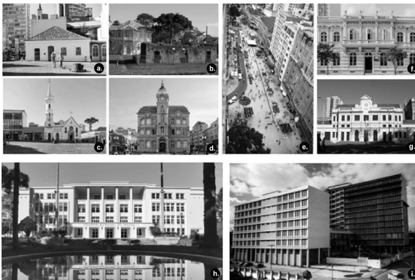
Figura 5: Ejemplos de edificios de las primeras etapas de declaración de tumbado en Curitiba: a) Romário Martins (séc. XVIII); b) Ruinas de San Francisco (1811); c) Iglesia de la Orden de San Francisco (1880); d) Pazo Municipal (1916); e) Calle XV de Noviembre (1972); f) Estación de Ferroviaria (1913); g) Pazo de Gobierno (1880); h) Colegio Estadual de Paraná (1950); i) Rectoría de la Universidad Federal de Paraná (1956/1958).