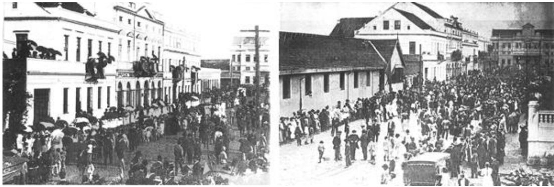
Figura 1: Festividades cívicas en la región de la Estación de Ferroviaria de Curitiba (Primera mitad del siglo XX).