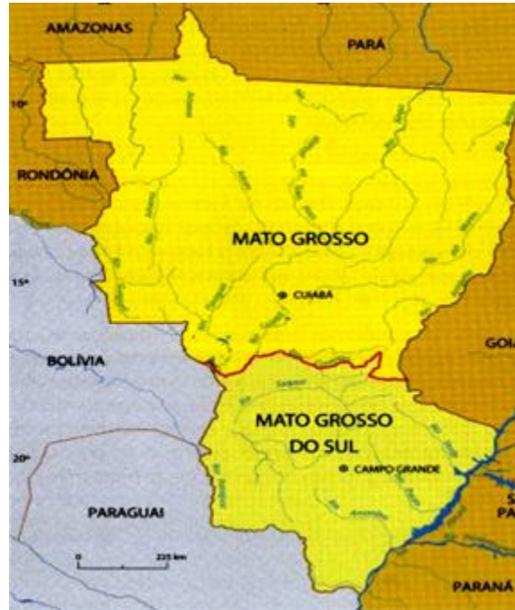
Figura 2: División del Estado de Mato Grosso (1977)