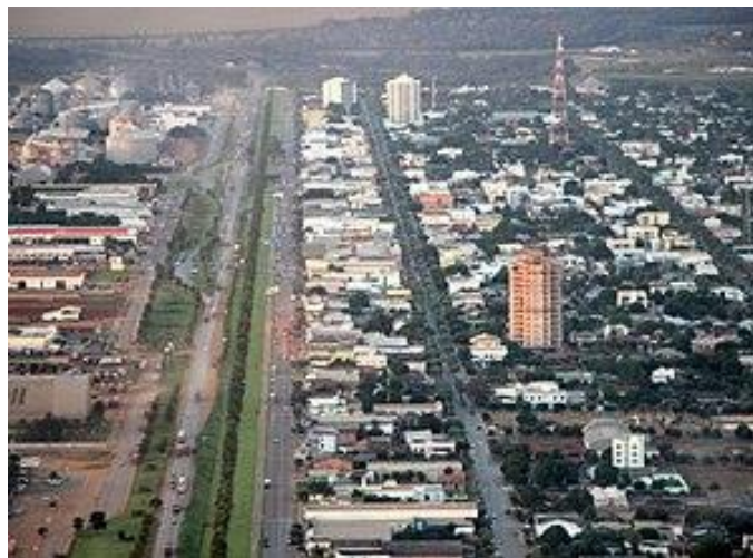
Figura 4: Tramo de la BR-163 que cruza Lucas do Rio Verde