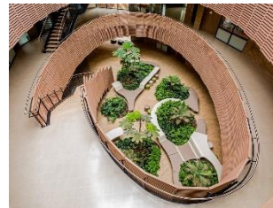
Figura 17 – Colégio Anglo Colombiano