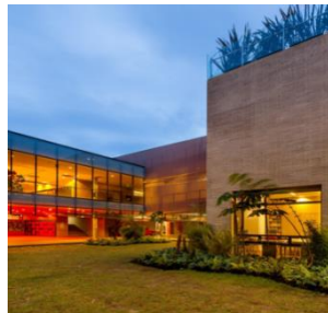
Figura 18 – Colégio Anglo Colombiano