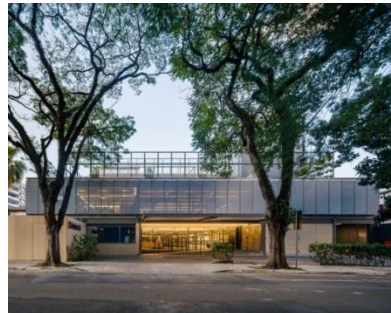
Figura 7 – Escola Aubrick