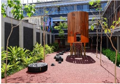
Figura 9 – Escola Aubrick