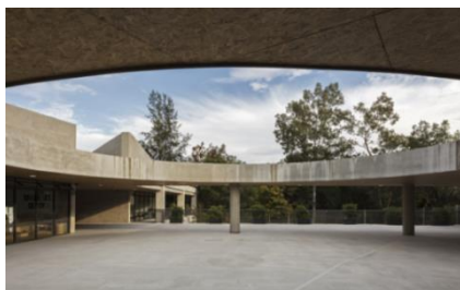
Figura 12 – Escola Infantil Beehave

A experiência direta com a natureza, conforme desenvolvida pelos autores Kellert e Calabrese (2015), pode ser observada na integração da paisagem local com a arquitetura, trazendo a natureza para dentro da sala de aula, como pode ser visualizado na Figura 13. Essa conexão também é trabalhada na abertura da laje na entrada da escola, conforme mostrado na Figura 12, possibilitando a conexão com a paisagem local e o céu, além de permitir a entrada de luz natural e ventilação. Nas Figuras 13 e 14, é possível perceber a presença de materiais naturais, como a madeira e o tijolinho, assim como formas naturais e orgânicas, como o balcão da recepção da escola e os móveis arredondados, baseados na experiência indireta com a natureza.