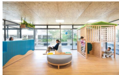
Figura 13 – Escola Infantil Beehave