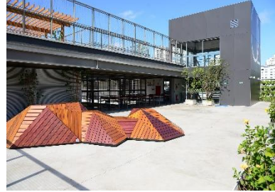
Figura 10 – Escola Aubrick