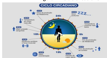
Figura 2 – Ciclo circadiano

De acordo com a Figura 2, pode-se observar que às 9 horas ocorre o pico de produção de cortisol, conhecido como o hormônio do estresse. Esse hormônio é produzido pelas glândulas suprarrenais, localizadas acima dos rins, e tem a função de ajudar o organismo a controlar o estresse, reduzir inflamações, contribuir para o funcionamento do sistema imunológico e manter os níveis de açúcar no sangue e a pressão arterial constantes. Os níveis de cortisol variam ao longo do dia devido à atividade diária e à serotonina, que é responsável pela sensação de prazer e bem-estar. O período das 10 horas é considerado o momento de maior alerta. Já às 14:30, ocorre o pico de concentração do dia. Às 17 horas, há predisposição para uma maior eficiência cardíaca e força muscular. A pressão sanguínea atinge o pico mais elevado às 18:30, seguido pela temperatura corporal mais alta às 19 horas. A produção de melatonina é retomada às 21 horas, iniciando o sono profundo por volta das 2 horas da manhã.