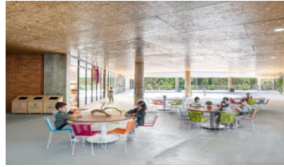
Figura 15 – Escola Infantil Beelieve