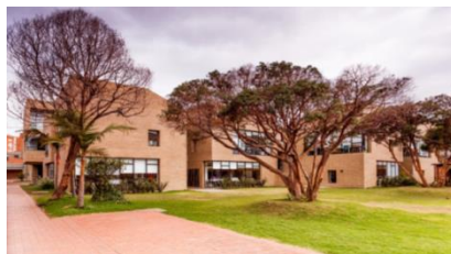
Figura 16 – Colégio Anglo Colombiano

A partir do conceito desenvolvido pelos autores Kellert e Calabrese (2015), o design biofílico é valorizado neste projeto, na qual a experiência direta e indireta com a natureza é incorporada através de várias estratégias. A presença de uma área verde central para a construção dos módulos, como ilustrado na Figura 16, promove a conexão dos estudantes com a natureza. O aproveitamento da luz natural é destacado nas salas de aula, conforme mostrado na Figura 19, onde as aberturas zenitais proporcionam uma abundância de luz natural. A utilização de materiais naturais, como a madeira, e formas orgânicas, como o desenho do pátio em forma oval e os bancos orgânicos, adicionam uma riqueza de informações e uma conexão com a natureza, como ilustrado na Figura 17. Os sheds circulares permitem a entrada de luz natural, enquanto as imagens de natureza em forma de árvore nos quadros fornecem uma representação visual da natureza dentro das salas de aula, como visto na Figura 19.