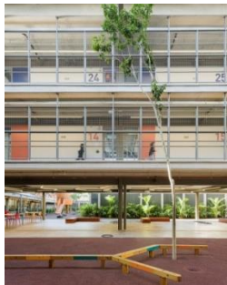
Figura 6 – Escola Aubrick