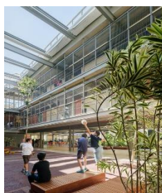
Figura 8 – Escola Aubrick