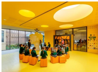
Figura 19 – Colégio Anglo Colombiano