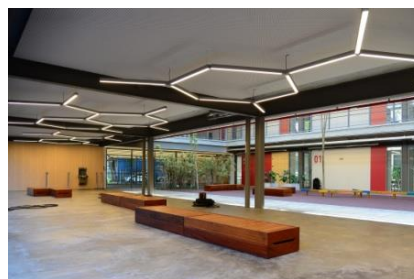
Figura 9 – Escola Aubrick