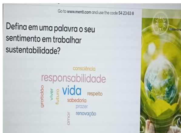
Figura 1: Nuvem de palavras (Mentimeter).