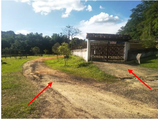
Figura 3 – Falta de manutenção na pista de caminhada (à esquerda) e na rampa de entrada do prédio administrativo (à direita)