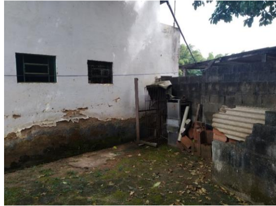
Figura 4 – Acúmulo de entulho e patologias existentes na edificação dos sanitários