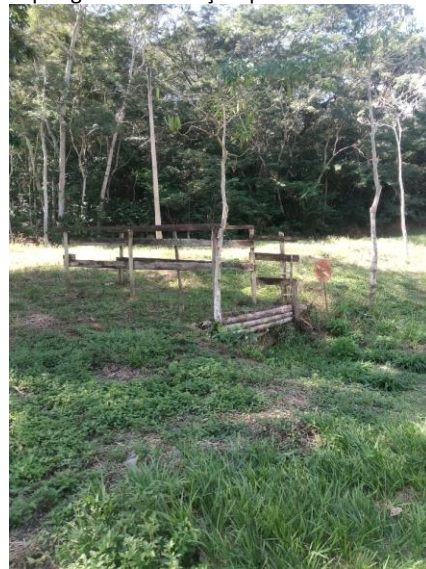
Figura 6 – Mobiliários de baixa qualidade e que podem ser perigosos às crianças que brincam no local