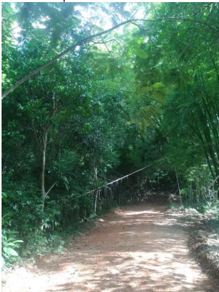
Figura 5 – Falta de manutenção nas árvores durante a pista de caminhada