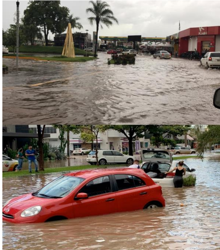
Figura 1 – Alagamento na avenida Júlio Campos e avenida das Embaúbas

Sinop, vivencia um notório processo de urbanização, caracterizado por uma expansão territorial acelerada, marcada pelo desenvolvimento de novos bairros e alta especulação imobiliária. Este fenômeno desencadeou uma considerável impermeabilização do solo urbano, gerando desafios significativos relacionados à infiltração da água pluvial e ao escoamento superficial. Alguns pontos da cidade são mais propensos aos alagamentos, principalmente nas avenidas de grande fluxo (figura 1), o que ocasiona uma problemática ainda maior.