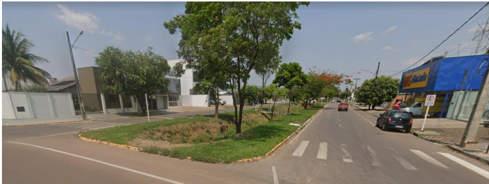
Figura 3 – Valeta localizada na avenida dos Flanboyants.

transbordam, e a água fica acumulada nas vias. Nessa perspectiva, o planejamento da inserção de novas áreas verdes distribuídas no perímetro urbano pode contribuir com a capacidade de drenagem das águas pluviais, uma vez que esses ambientes conseguem absorver água.