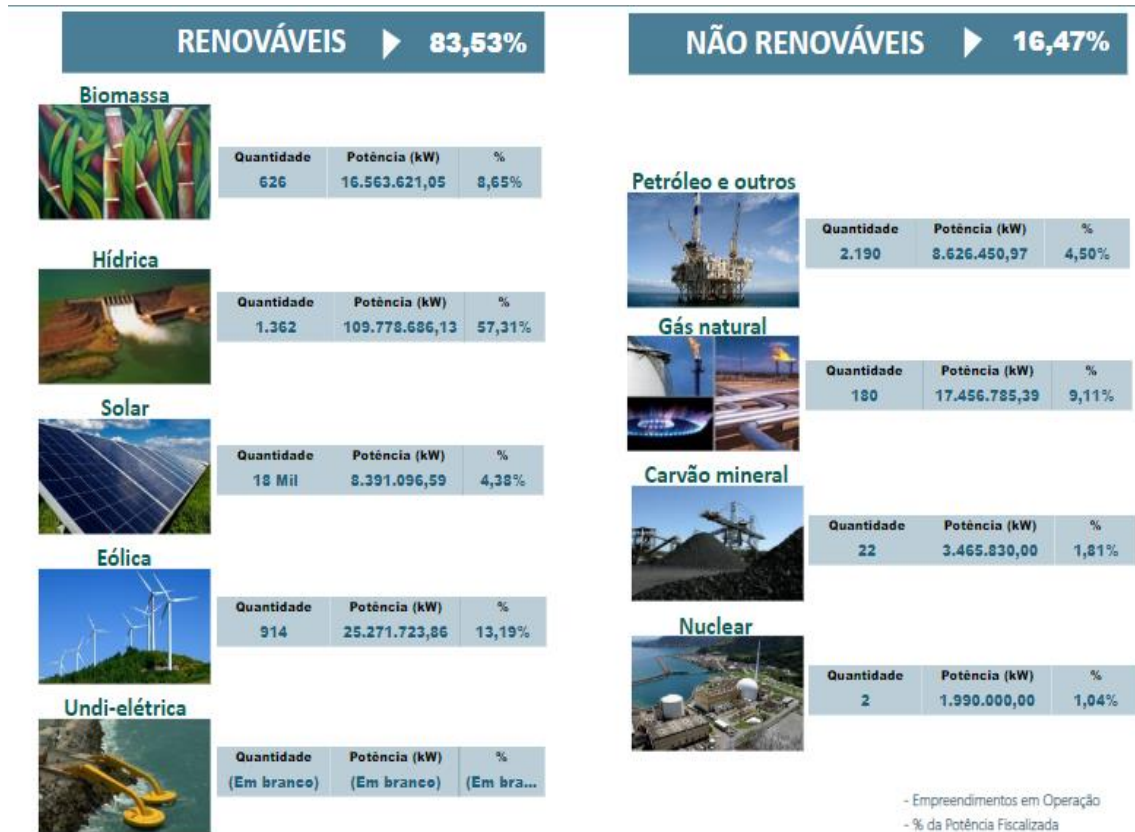
Figura 1 . Matriz energética Brasileira