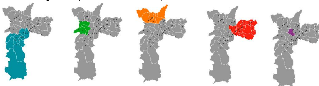
Figura 6 - Mapas de las 48 escuelas municipales de la ciudad de São Paulo hasta 1966