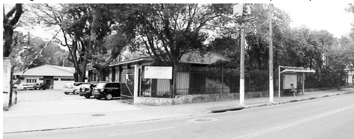
Figura 1 – EDIF en Avenida IV Centenário 1268, Parque Ibirapuera.

El edificio donde EDIF funcionó, durante aproximadamente 44 años, fue construido bajo la dirección del alcalde Prestes Maia, entre los años 1961 y 1962, con el propósito de albergar las actividades de la Comisión de Concertación Escolar. EDIF funcionó hasta el año 1960 en un edificio alquilado en la calle Brigadeiro Tobías, cuando el alcalde Prestes Maia, reconociendo la importancia de su actividad, construyó el edificio definitivo para su sede, la avenida IV Centenário 1268, junto al Parque Ibirapuera. Allí, la estructura del edificio correspondía a un organigrama centrado en las actividades del Comité Ejecutivo del Convenio Escolar. En los planos del pequeño edificio de madera se reconoce la organización del organismo que tenía como objetivo estructurar la red escolar de la capital. Actualmente, esta dirección está ocupada por otra agencia municipal, UMAPAZ, vinculada a la Secretaría Verde, que la solicitó, lo que significó la pérdida de una dirección de referencia del Municipio de São Paulo.