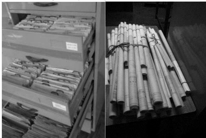
Figura 2 Carpeta EDIF y documentos técnicos