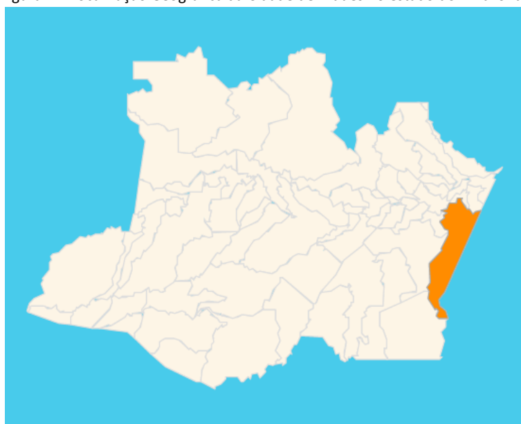
Figura 2 – Localização Geográfica da Cidade de Maués no estado do Amazonas.