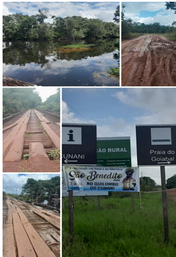
Figura 3- Mosaico de imagens do acesso sul do PNCO

Ao acessar a Avenida dezessete de agosto, em Calçoene, o turista/visitante irá se deparar com uma bifurcação (conforme imagem a seguir), sinalizada, que indica a estrada para a Vila de Cunani e para a Praia do Goiabal 2 , este seguirá o acesso ao Cunani e a região sul do PARNA. Importante frisar que o turista passará por aproximadamente 10 pontes de madeira (algumas em situação precária de conservação, conforme a Figura 3) até chegar à Vila de Cunani, que possui área sobreposta pelo Parque.